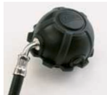
AutoMaXX-N Erogatore a domanda con attacco conforme a EN 148-1 [soluzione tradizionale]