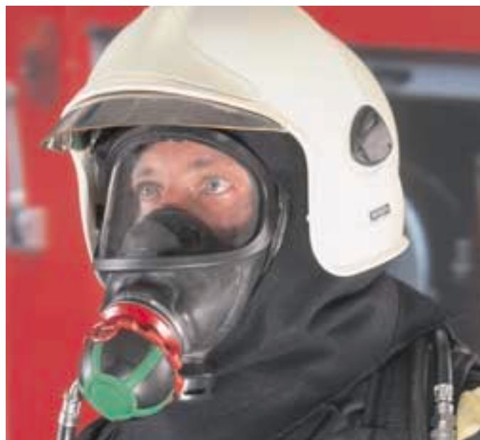
3S con AutoMaXX AS-C [combinazione fra tradizione e futuro]

Per dettagli consultare bollettino ID 05-405.2 ITL.