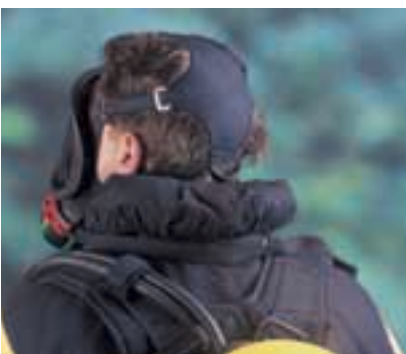
Ultra Elite PF con bardatura EZ-Don. Disponibile anche per maschere della serie 3S [perfetta tenuta]