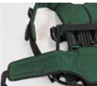
Bardatura AirMaXX L'imbottitura della cintura e degli spallacci assicura un perfetto indossamento [Semplicemente confortevole]