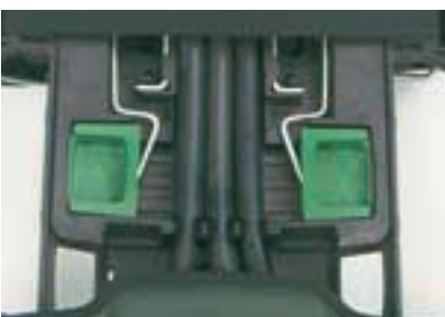
Telaio trasporto AirMaXX La triplice regolazione in lunghezza assicura un indossamento confortevole [Massima flessibilità]

AirMaXX si adatta con comodità e sicurezza, anche se si è in posizione capovolta.