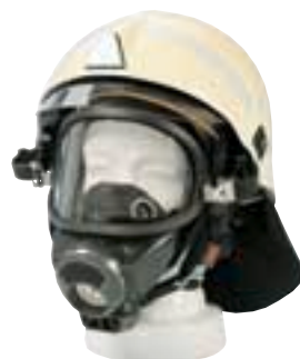
3S-H [con elmetto Schubert F200]

Per dettagli si prega consultare i bollettini ID 05-434.2 ITL e ID 06-234.2 ITL