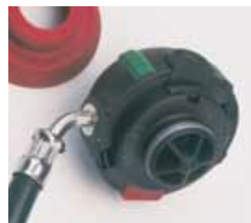
AutoMaXX-AS Erogatore a pressione positiva completo di innesto rapido [alimentazione aria completamente automatica]