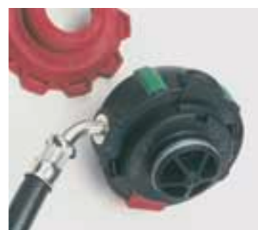
AutoMaXX-AS-C Combina la filettatura standard M 45 x 3 con l'attacco rapido [incrocio di generazioni]