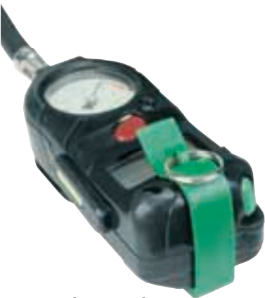
ICU-S [Con chiave]