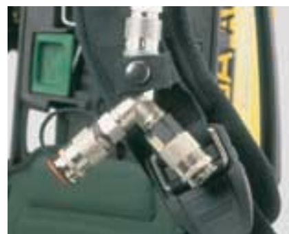
AirMaXX-Z Il secondo attacco per applicazioni di salvataggio [sicurezza per 2 operatori]