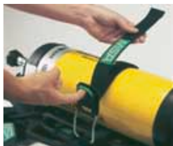
Fascetta tenuta bombola AirMaXX. Sostituzione estremamente semplice [semplicemente veloce]