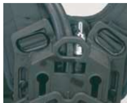
AirMaXX-S Segnale di allarme posizionato vicino all'orecchio [per applicazioni in ambienti rumorosi]

red dot premio 2001 miglior design prodotti industriali