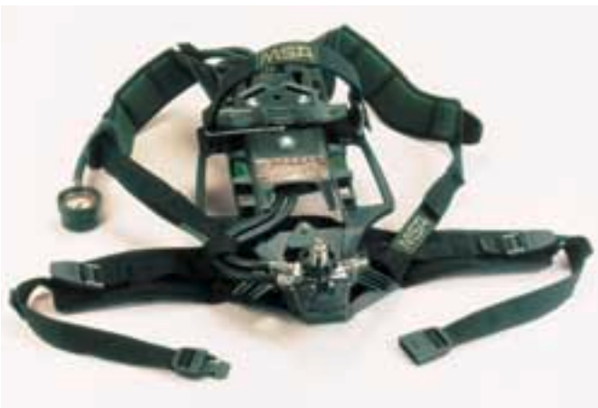
Apparecchio base AirMaXX [Il comfort è lo standard]

[ Ergonomia & Comfort per la Sicurezza ]