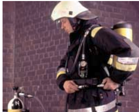
Sistema ricarica veloce