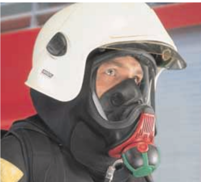
Ultra Elite PF con erogatore AutoMaXX AS [elevatissimo comfort]