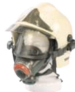
3S-HG [con elmetto Gallet]