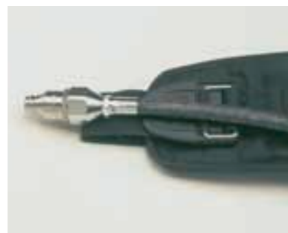
AirMaXX-Q La connessione Quick-Fill consente la ricarica della bombola con apparecchio indossato [riempimento in 45 secondi]